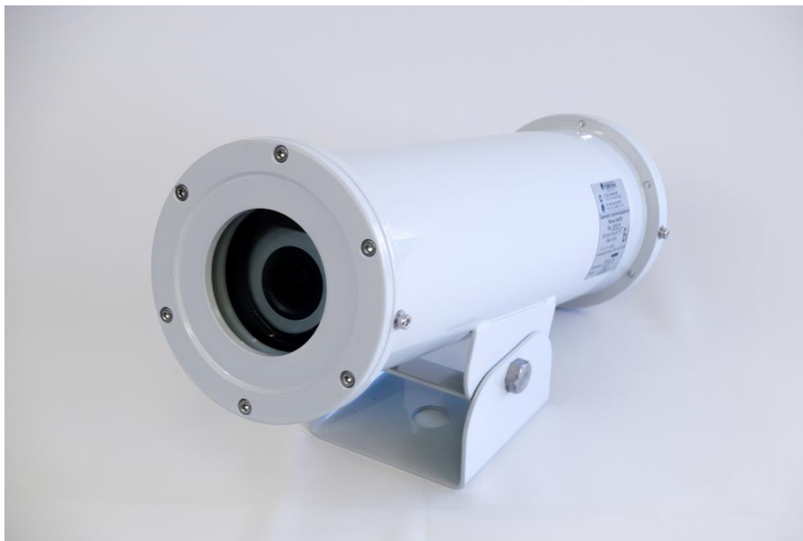
Рис. 1 БВК-РВ. Внешний вид

Внутреннее устройство БВК-РВ ВEW-1ТХ-АARFRZ-35.75 показано на Рис. 2